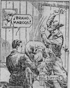
TOMÁS TIENE ACCORRALADO A BENTLY MIENTRAS BENTLY ESTÁ CERCA AL AVION, PERO EN ESE MOMENTO MARCOS VE A LA MUJERCHÁ.